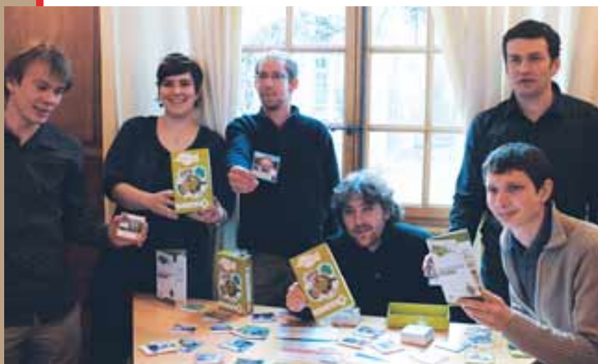
Les jeunes du MRJC posent fièrement devant leur création « Les Agronautes ».

Bon, mais le jeu ? Ses créateurs le confessent, il faut tout de même avoir un minimum de connaissances sur le milieu agricole pour y participer. Sous cette réserve, il rassemble sept joueurs sous la houlette d'un animateur, chargé d'expliquer les cartes tirées et les événements survenus au cours du jeu. Chaque participant est mis dans la peau d'un professionnel qui monte un projet d'installa-